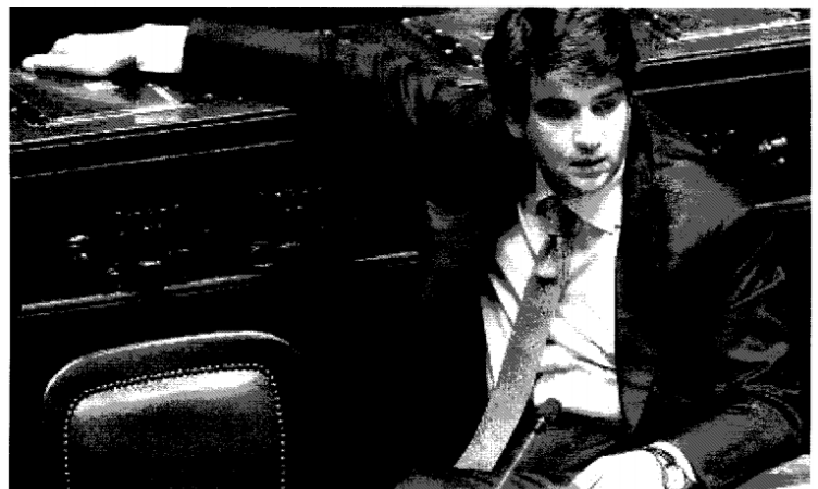
Il ministro degli Affari regionali Raffaele Fitto

Nel 2006 l'imprenditore Gianpaolo Angelucci fu colpito da un ordine di arresto domiciliare